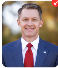
Wes Allen LIEUTENANT GOVERNOR