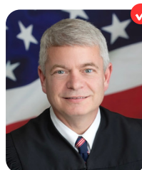
Ben Bowden ALABAMA COURT OF CIVIL APPEALS - PLACE 4