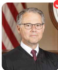
Brad Mendheim ALABAMA SUPREME COURT - PLACE 7