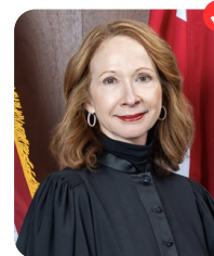
Mary Windom ALABAMA COURT OF CRIMINAL APPEALS - PLACE 4