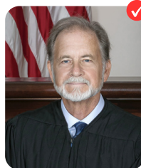
Greg Shaw ALABAMA SUPREME COURT - PLACE 8