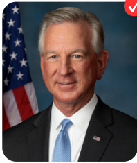
Tommy Tuberville GOVERNOR