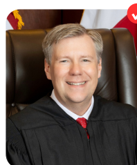
Matt Fridy ALABAMA COURT OF CIVIL APPEALS - PLACE 5